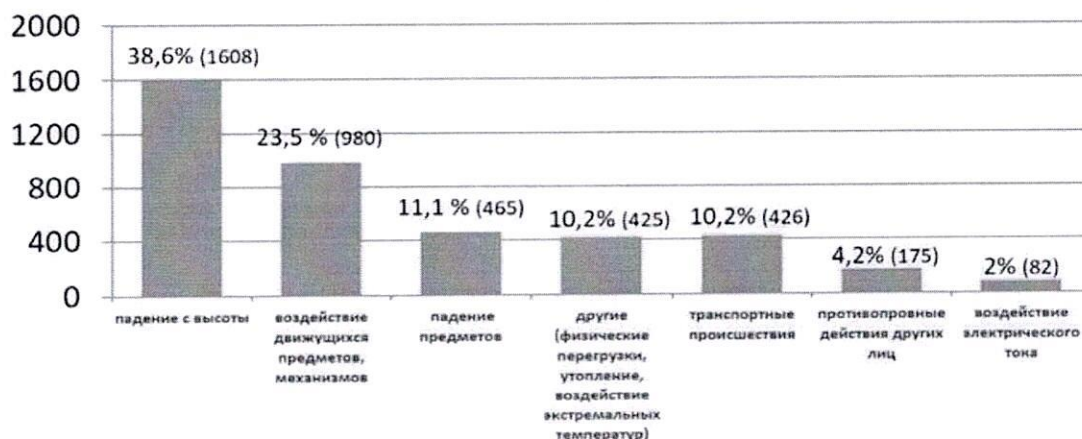
ВИДЫ (ТИПЫ) ТЯЖЕЛЫХ НЕСЧАСТНЫХ СЛУЧАЕВ НА ПРОИЗВОДСТВЕ (ПО ДАННЫМ РОСТРУДА) В 2019 Г.

Основная причина травматизма - неудовлетворительная организация производства (32,4%).