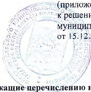
Таблица № 1

(приложение № 7 к решению Совета Нурлатского муниципального района от 15.12.2020 № 31 в новой редакции)