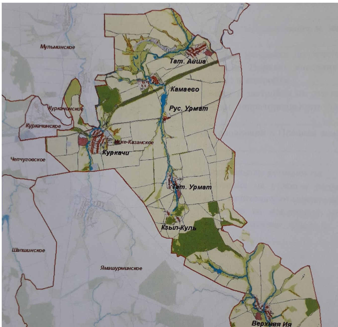
Рисунок 2 - Расположение Иске-Казанского сельского поселения на территории Высокогорского муниципального района

Расположение Иске-Казанского сельского поселения на территории Высокогорского муниципального района показано на Рисунке 2.