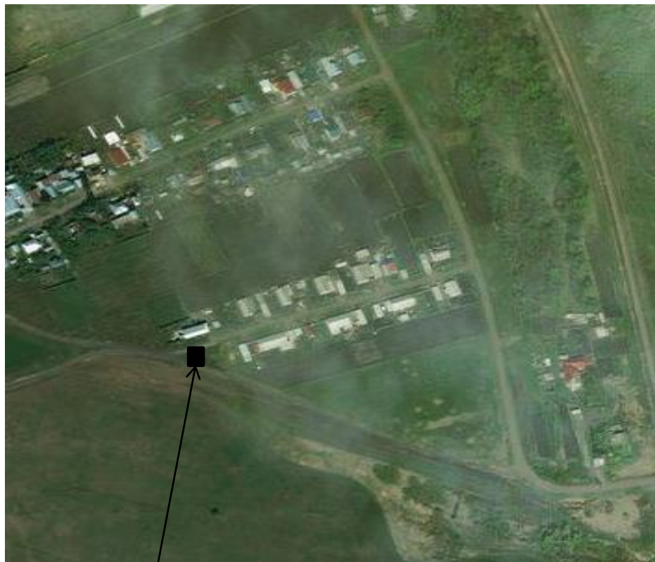
Место (площадка) накопления ТКО