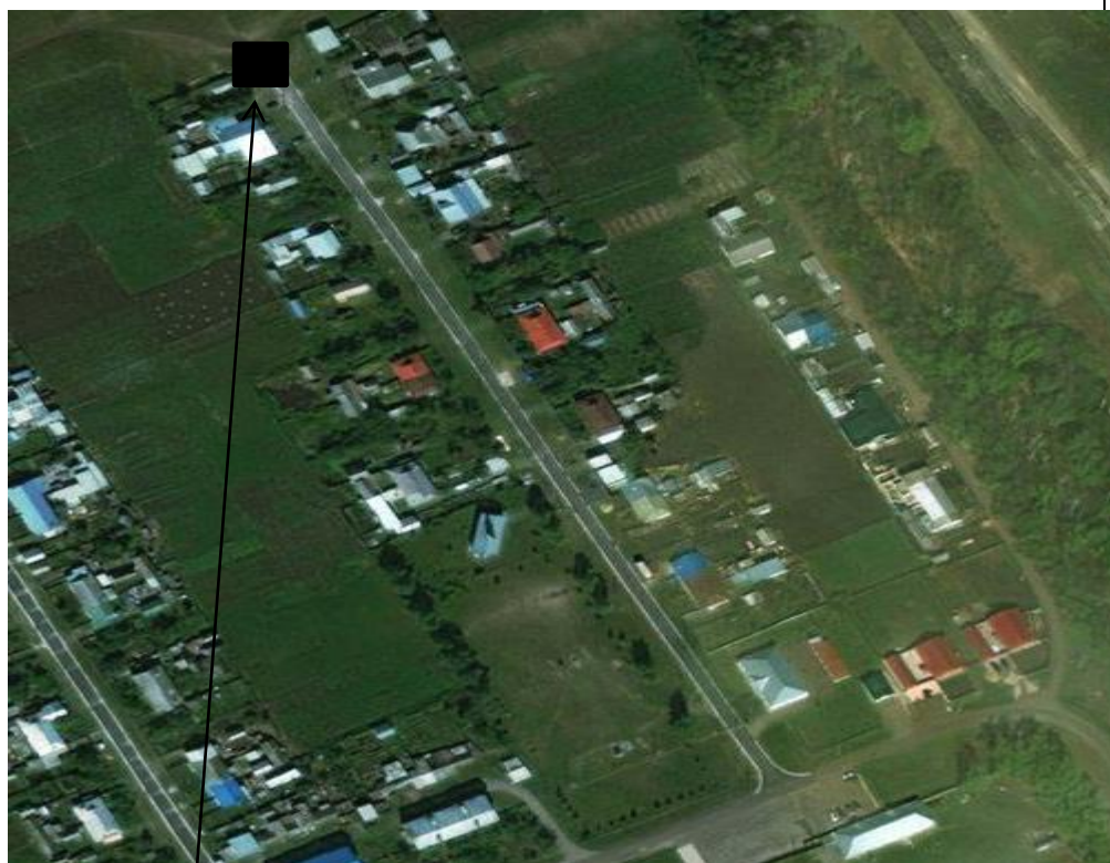
Место (площадка) накопления ТКО