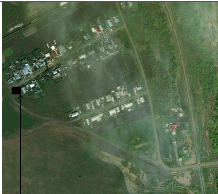
Место (площадка) накопления ТКО