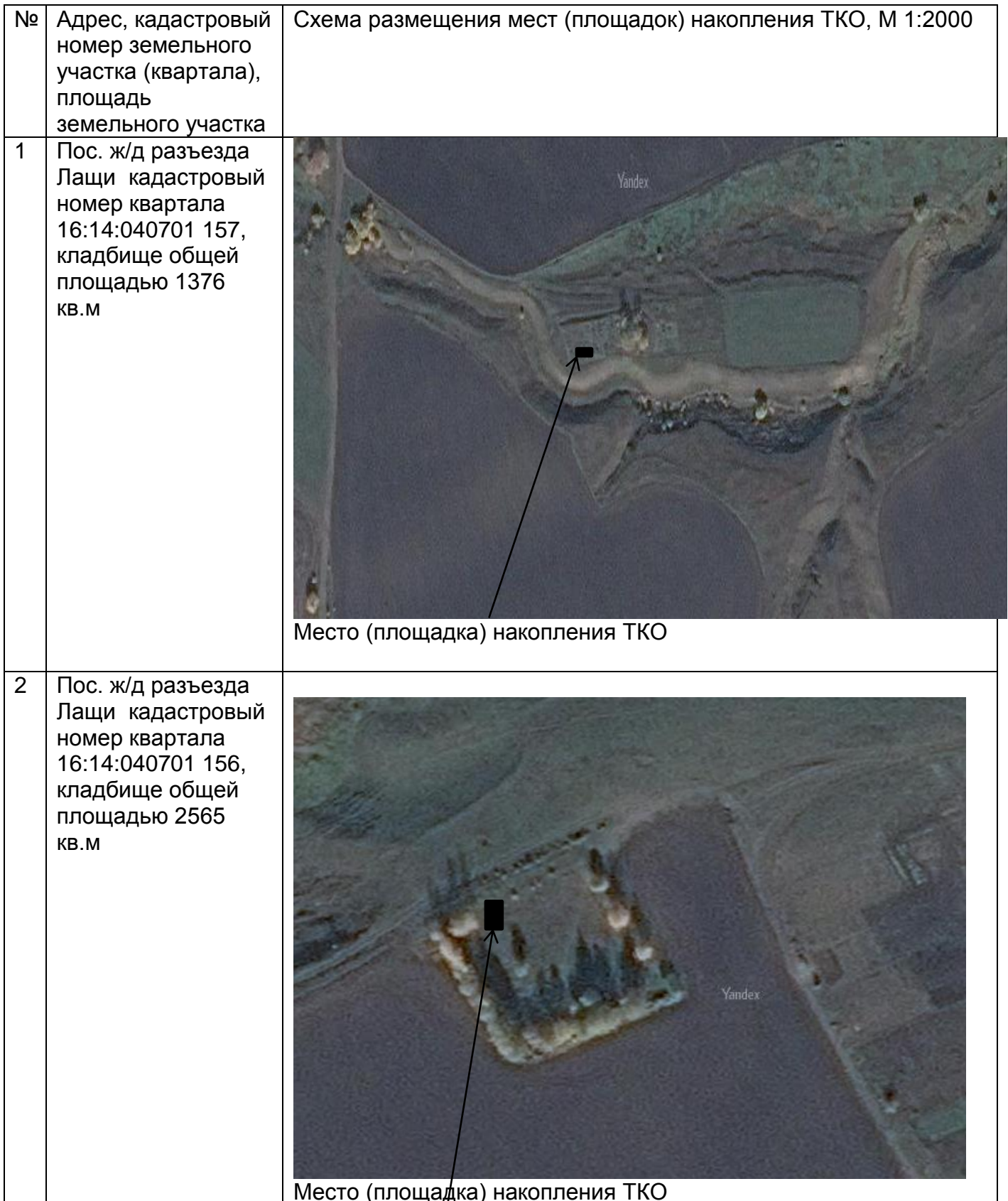
Схема размещения мест (площадок) накопления твердых коммунальных отходов на территории Черки-Гришинского сельского поселения Буинского муниципального района Республики Татарстан.