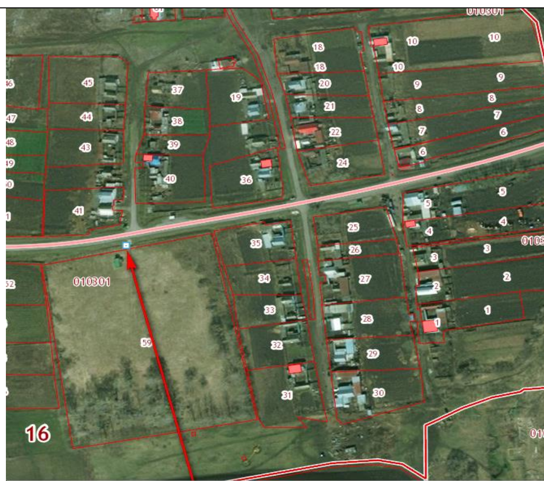
Место (площадка) накопления ТКО (д. Атабай-Анкебе, кладбище)

3 Д.Атабай-Анкебе, дорога Буинск-Исаково, кадастровый номер квартала 16:14:010301