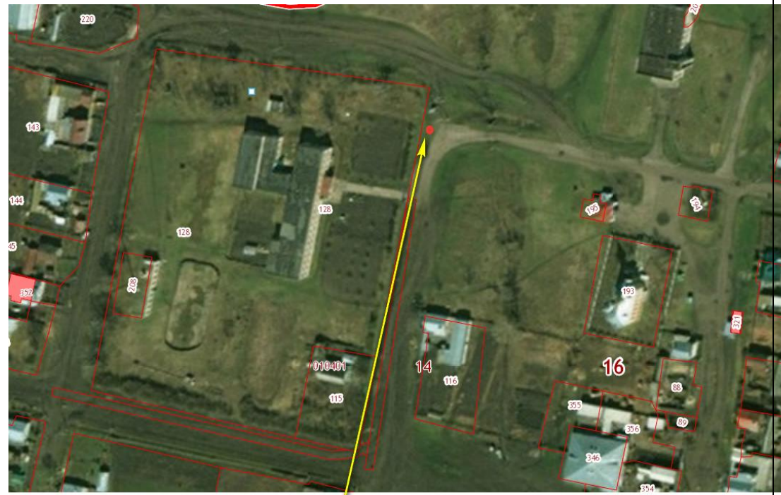
Место (площадка) накопления ТКО

2 С.Исаково, ул. Школьная, кадастровый номер квартала 16:14:010401