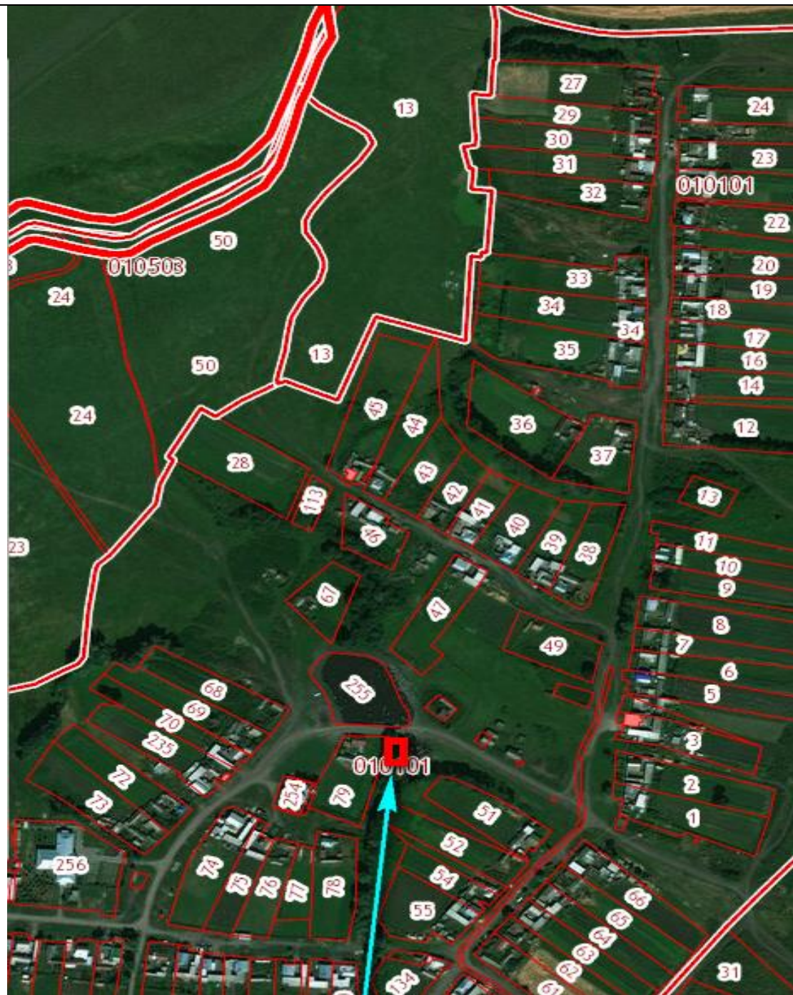
Место (площадка) накопления ТКО (с. Алькеево ул. Дружбы)

с.Алькеево, ул.Дружбы, кадастровый номер квартала 16:14:010101