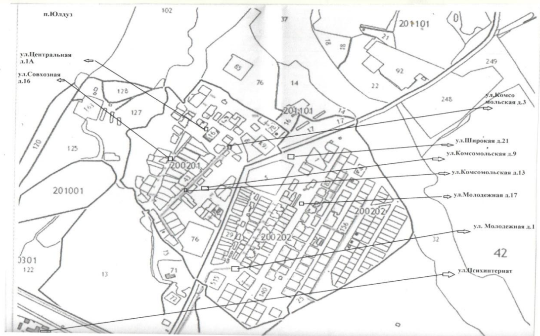
Схема размещения мест (площадок) накопления твердых коммунальных отходов на территории муниципального образования «Булдырское сельское поселение» Чистопольского муниципального района