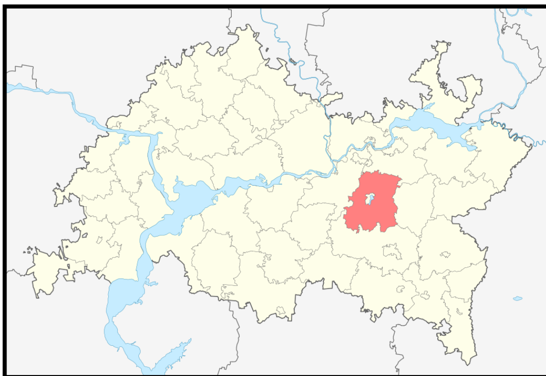
Рисунок 1 – Расположение Заинского муниципального района на территории Республики Татарстан

В Заинском районе – 1 городское и 22 сельских поселений, которые включают в себя 86 населенных пунктов – их перечень приведен в Таблице 1.