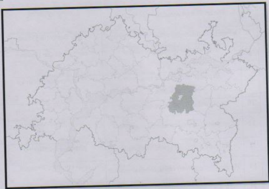
Рисунок 1 – Расположение Заинского муниципального района на территории Республики Татарстан

В Заинском районе – 1 городское и 22 сельских поселений, которые включают в себя 86 населенных пунктов – их перечень приведен в Таблице 1.