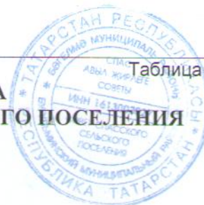
Таблица 2 ВЕДОМСТВЕННАЯ СТРУКТУРА РАСХОДОВ БЮДЖЕТА СПАСКОГО СЕЛЬСКОГО ПОСЕЛЕНИЯ НА 2018-2019 ГОДЫ