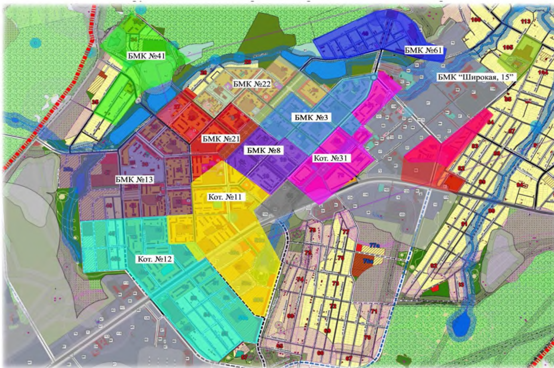
Рисунок 4. Перспективная схема зон покрытия потребителей тепловой энергией