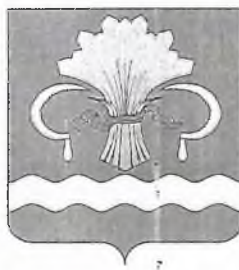
СХЕМА водоснабжения и водоотведения Ишкеевского сельского поселения Мамадышского муниципального района Республики Татарстан до 2030 года