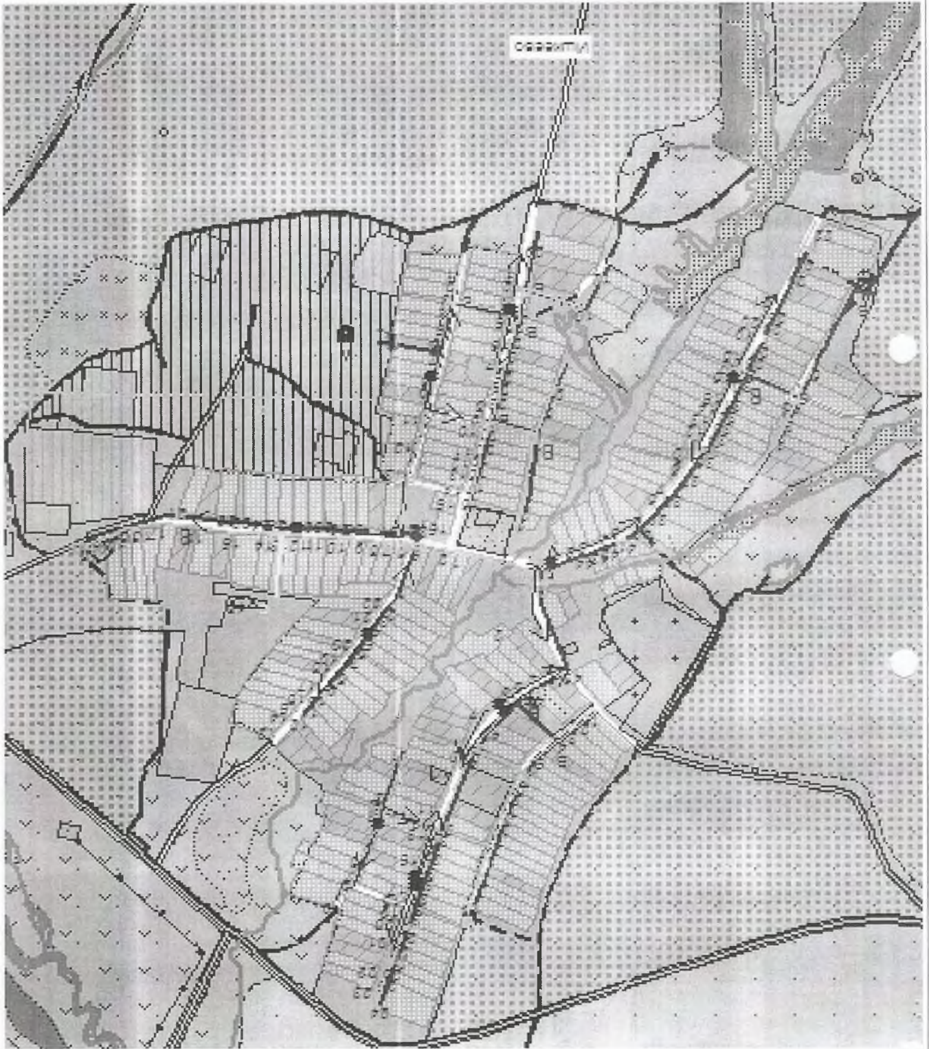
Схема системы водоснабжения н.п. Ишкеево Ишкеевское сельское поселение Мамалышского муниципального района РТ