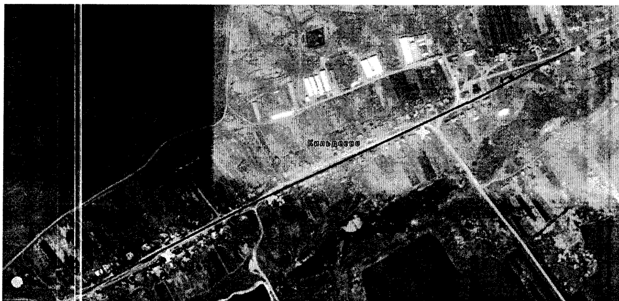
Схема водопроводных сетей с. Кильдеево