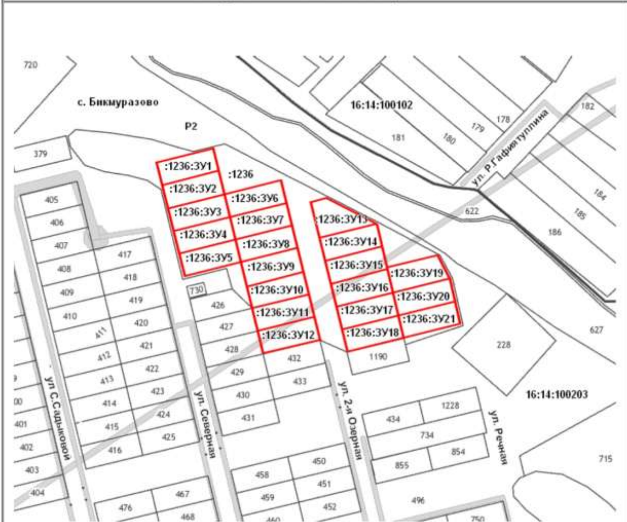
Схема расположения земельных участков