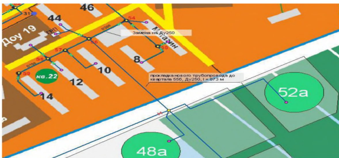
Рисунок 4. Замена существующего участка тр-да и прокладка нового тр-да в направлении квартала 55б

Для обеспечения возможности подключения потребителей тепловой энергии кварталов №48а, 52, 52а, 53а, 55б необходимо осуществить перекладку участка тепловой сети от тепловой камеры №56 до тепловой камеры №58 (на рисунке 4) с Ду200 мм на Ду250 мм протяженностью 67 м. От камеры №58 в направлении квартала 55б осуществить прокладку магистральной тепловой сети диаметром Ду250 мм и протяженностью l = 873 м.