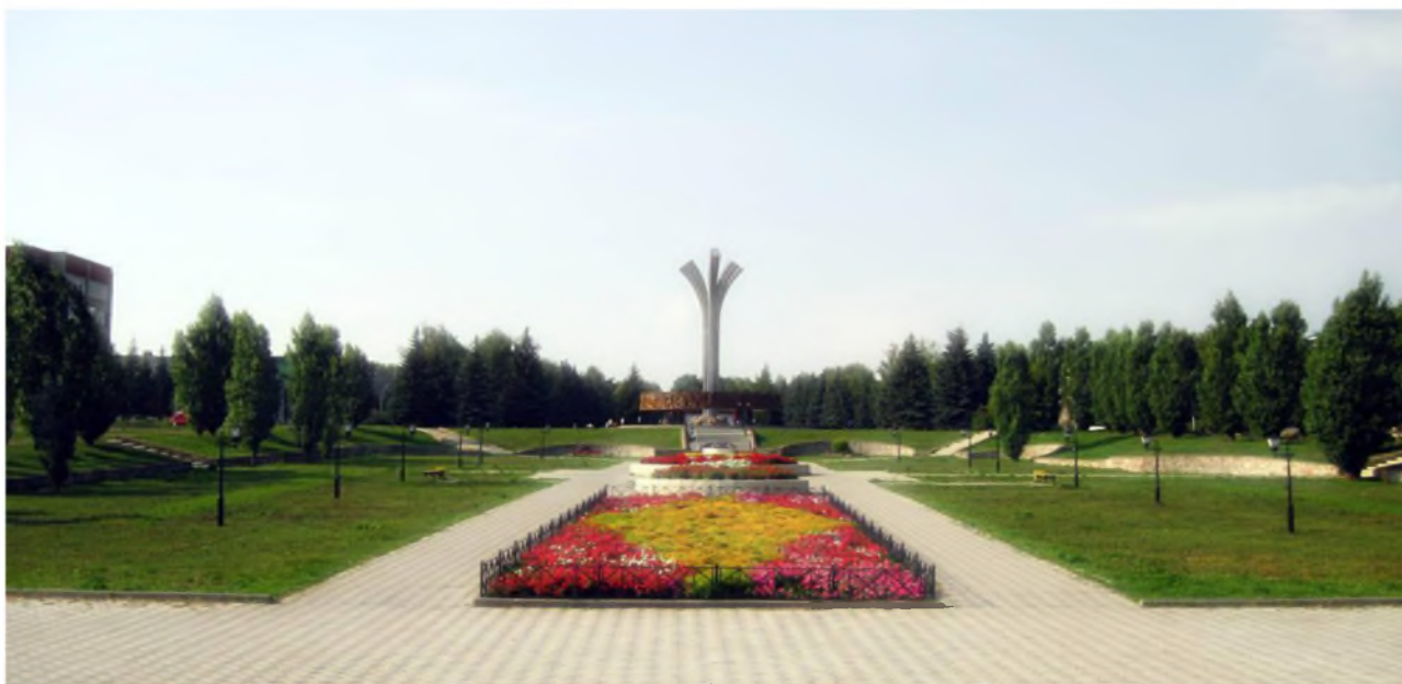
Рисунок 1. Муниципальное образование город Лениногорск

Лениногорск — город (основан в 1795 году как село Новая Письмянка, статус города с 1955 года) в России, административный центр Лениногорского района (с 1935 года). Город Лениногорск расположен в юго-восточной части Республики на склонах Бугульминско-Белебеевской возвышенности в верхнем течении р. Степной Зай в 322 км от Казани и 35 км от Альметьевска, в живописном месте, окруженный лесами и величественными холмами с перепадами высот более 100 метров г. Лениногорск занимает территорию, площадью 34,04 кв.км.