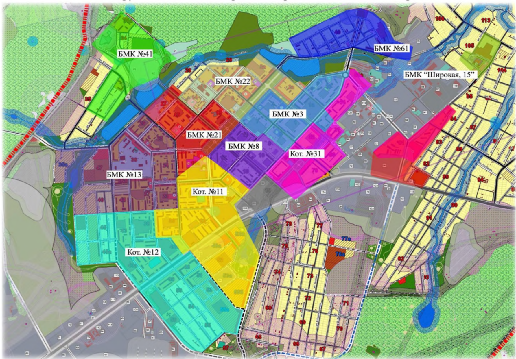
Рисунок 4. Перспективная схема зон покрытия потребителей тепловой энергией